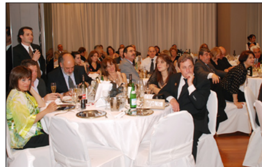
Delegación de la provincia de Entre Ríos, en Cena de Despedida.