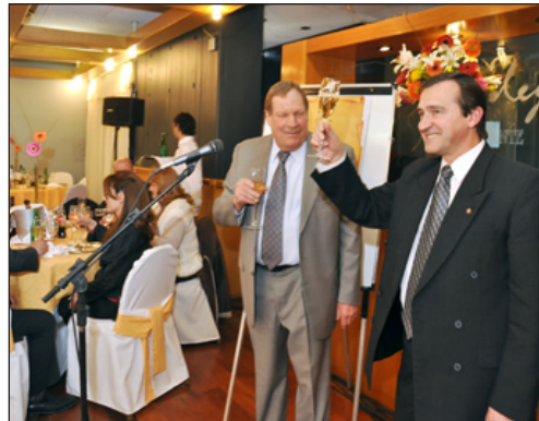
Arriba: El Presidente de CODESA y Vicepresidente, proponen a todos los presentes en el almuerzo del Hotel Alkazar un brindis por el pasado, presente y futuro de la Institución.