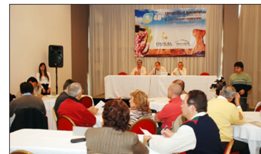
Arriba: Deliberaciones de la 48ª Convención Nacional Abajo: Acto en la Casa Natal del Maestro de América, Domingo Faustino Sarmiento