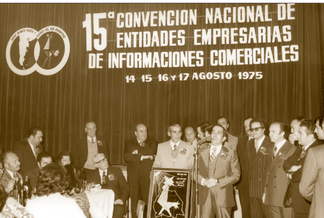
Imagen superior: La Delegación sanjuanina de CODESA, presentes y participando en la 15° Convención Nacional de Entidades Empresarias de Informaciones Comerciales (Bahía Blanca, agosto 1975).