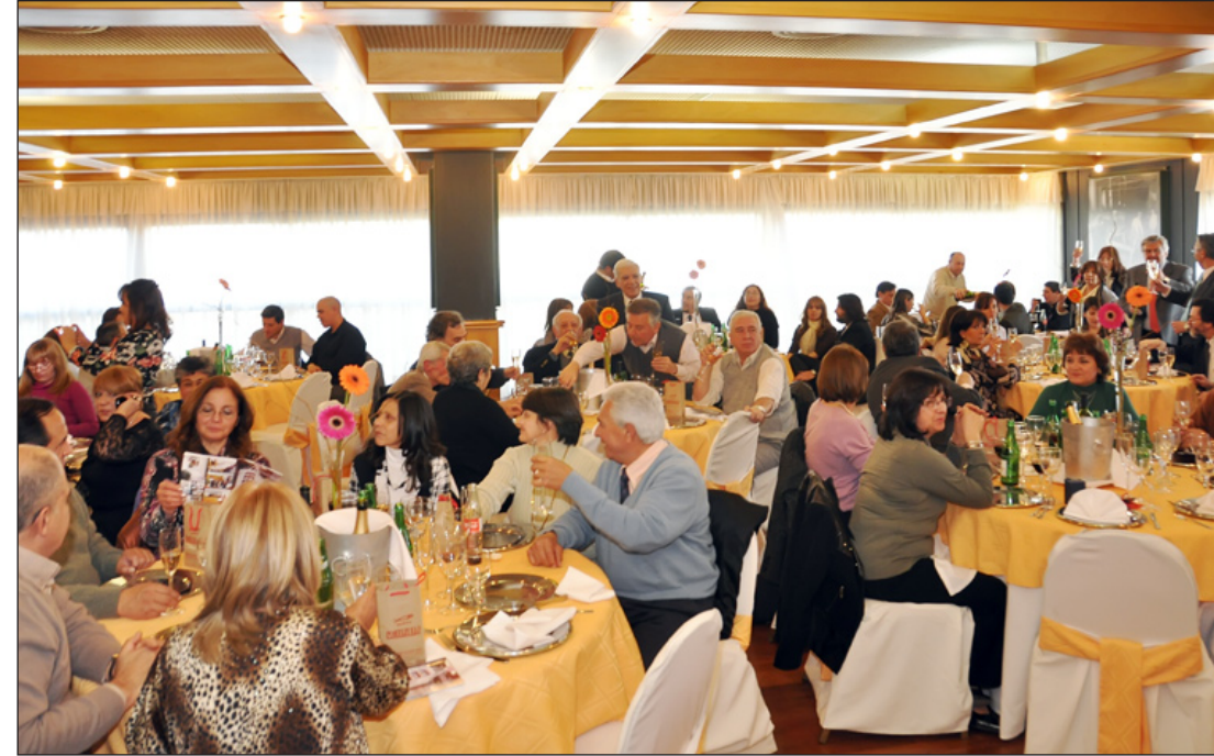
Imagen Superior: Momento de la feliz y distendida sobremesa, en Alkazar Hotel, donde la familia de CODESA se convocó para celebrar los primeros cincuenta años de vida.